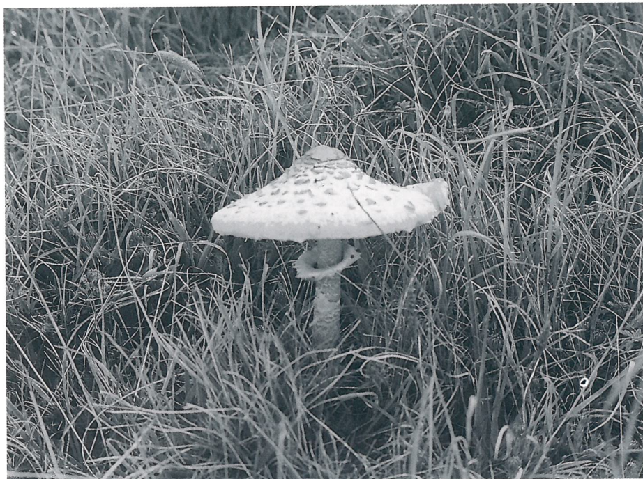
Fig. 3 — Macrolepiota procera , in un prato lungo la strada per Godrano (Palermo).