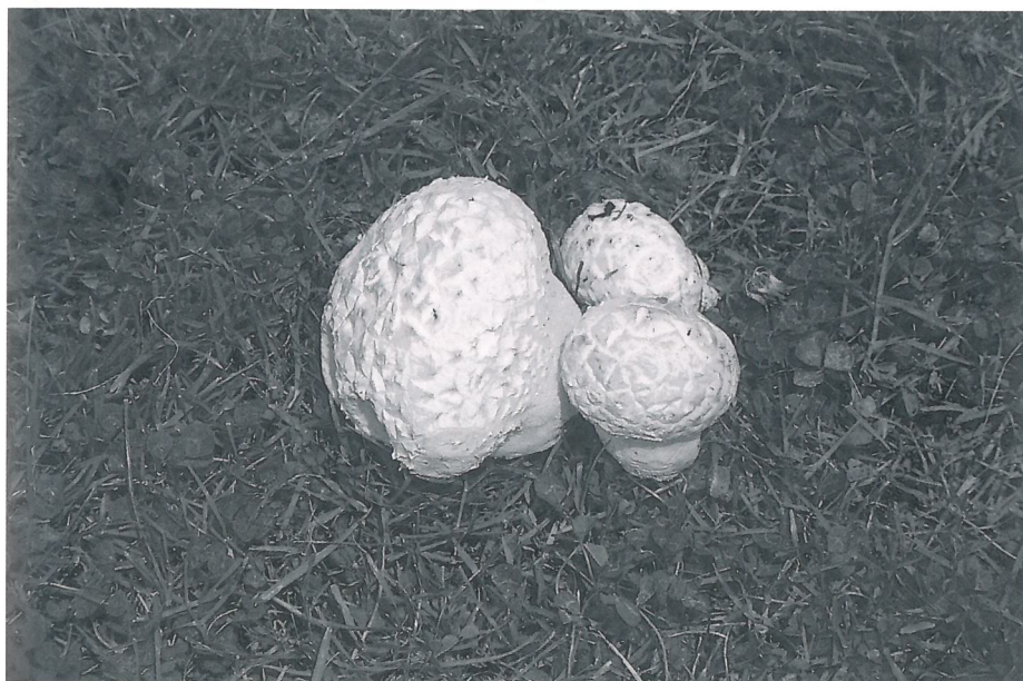
Fig. 5 — Calvatia utriformis è un fungo ubiquitario riconoscibile per l'esoperidio dello sporoforo che si lacera in numerosi campi rettangolari.