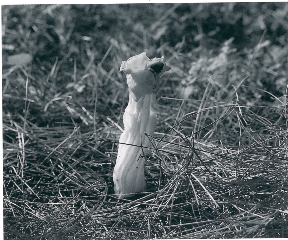
Fig. 1 — La spugnola crespa, Helvella crispa , ascomicete a comparsa autunnale riconoscibile per il colore beige chiarissimo sia sul cappello che sul gambo profondamente solcato.