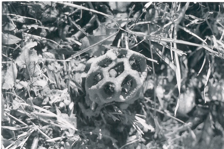
Fig. 4 — Clathrus ruber , gasteromicete non commestibile dall'odore repellente, rilevato nel Bosco della Ficuzza.